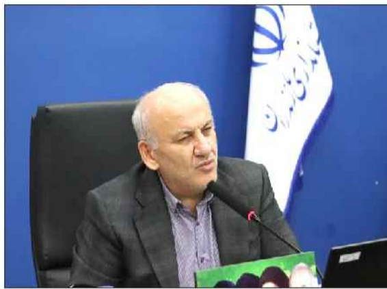
نهادهای ملی، سهمیه مازندران قطعی شده و هم‌اکنون فرایند اداری تحویل این خودروها در حال انجام است.

حال انجام است. وی با اشاره به اینکه اولویت تحویل بنا دهیاری‌هایی است که بیشترین نیاز را در حوزه حمل مصالح و جمع‌آوری زباله دارند، تصریح کرد: این خودروها از نوع کمپرسی بوده و به‌صورت کاملاً رایگان در اختیار روستاها قرار می‌گیرد تا گامی مؤثر در رفع محرومیت‌زدایی و عمران روستایی برداشته شود. استاندار مازندران در ادامه با تأکید بر لزوم نگهداری صحیح از این ناوگان جدید، از دیهاریان خواست تا با برنامه‌ریزی دقیق، از