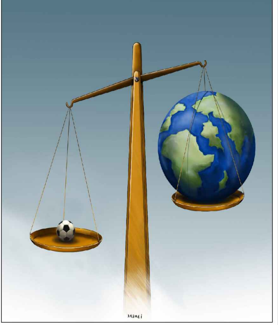
جام جهانی فوتبال و یک دنیا هوادار