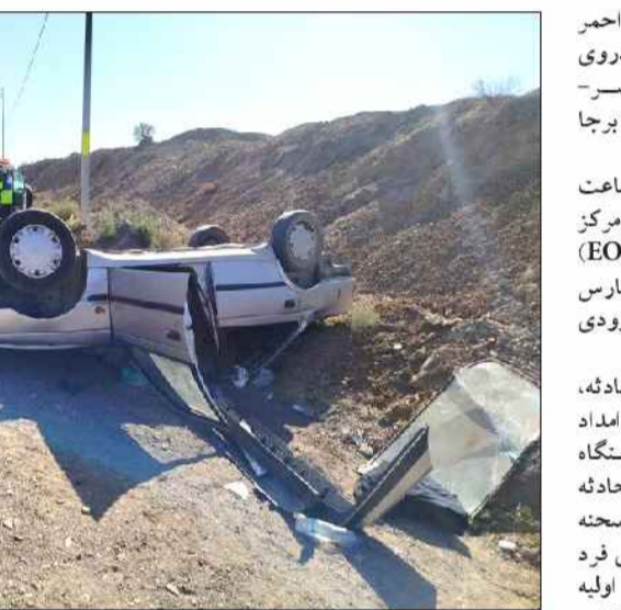
توسط عوامل اورژانس و هلال‌احمر جهت ادامه روند درمان به بیمارستان امام خمینی داد: در این حادثه ۳ نفر مصدوم شدند که

مرکز کنترل ترافیک پلیس راه استان با شماره ۲۱۸۲۴۳۴ و ۲۱۸۲۴۲۰ و با پیش شماره ۰۱۱ به طور شبانه روز آماده پاسخگویی در خصوص وضعیت راه‌های استان است. برابر آمار، سالانه بیش از ۵۰۰ میلیون دستگاه خودرو در محورهای مازندران تردد دارند که ۱۱ درصد از این تردها در محورهای اصلی و بقیه درون شهری است. مازندران ۱۰ هزار و ۴۰۰ کیلومتر راه اصلی و فرعی دارد که حدود سه هزار کیلومتر از آن جاده اصلی و بقیه محور روستایی است. هراز، کندوان، سوادکوه، کناره و جاده گولگاه ۶ محور اصلی مازندران است که این استان را به استان‌های تهران، البرز، سمنان، گیلان و گلستان متصل می‌کند. مسافران و رانندگان می‌توانند جهت آگاهی از آخرین وضعیت راه‌ها، انسدادها یا محدودیت‌های احتمالی تردد و شرایط جوی به سایت www.141.ir مراجعه کرده و یا با تلفن گویای ۱۴۱ تماس حاصل کنند.