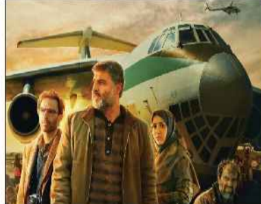
۱۶۰ هزار مخاطب و فروش بیش از ۱۰ میلیارد تومان به اکران خود در سینماها پایان داد. «احمد» که بر اساس روایتی واقعی ساخته شده است.