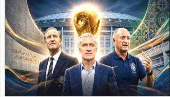
دیدید دشان سرمربی تیم ملی فرانسه این فرصت را دارد تا در جام جهانی ۲۰۲۶ با عبور از این نام‌های بزرگ خود را به عنوان باسابقه‌ترین سرمربی این رقابت‌ها معرفی کند.

در جایگاه هفتم قرار دارد و با برگزاری ۳ دیدار مرحله گروهی در این مسابقات می‌تواند به رکورد ۲۲ بازی و جایگاه سوم برسد. خروس‌ها که در دو دوره اخیر به فینال رقابت‌های جام جهانی رسیده و به یک عنوان قهرمانی و نایب قهرمانی رسیده‌اند، در این دوره نیز یکی از شانس‌های قهرمانی هستند. چنانچه فرانسه بتواند تا مرحله یک چهارم نهایی پیش برود این مربی فرانسوی به رکورد هلموت شون سرمربی افسانه‌ای آلمان خواهد رسید و در صورت صعود فرانسه از این مرحله دشان با ثبت ۲۷ بازی بالاتر از همه این نام‌ها، با سابقه‌ترین سرمربی تاریخ جام جهانی خواهد شد. ژانکو دالچ سرمربی تیم ملی کرواسی که در دو دوره اخیر جام جهانی به همراه این تیم عنوان نایب قهرمانی و سومی را کسب کرده با ۱۴ بازی در رتبه شانزدهم با سابقه‌ترین سرمربی تاریخ جام جهانی قرار دارد. او حالا این فرصت را دارد تا این رکورد خود را بهبود بخشد و بین ۱۰ مربی با سابقه قرار گیرد. همچنین کارلوس کی‌روش سرمربی سابق تیم ملی کشورمان که تجربه حضور در ۳ دوره رقابت‌های جام جهانی را با ایران دارد؛ با ۱۳ بازی، این شانس را دارد که به همراه غنا آمار خود را بهبود بخشد. او تنها با احتساب ۳ بازی مرحله گروهی غنا این شانس را دارد تا در بین ۱۵ مربی با سابقه تاریخ جام جهانی قرار بگیرد.