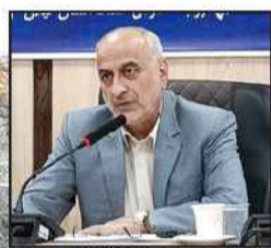
رئیس سازمان جهاد کشاورزی گیلان: در حال حاضر ۳۴۴۴ زوج نابارور گیلانی در راستای حمایت از خانواده و جوانی جمعیت، توسط سازمان بیمه سلامت، نشان دار شدند.