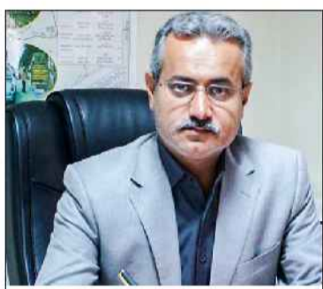
ایستادگی و سوازی تشکیل شده، موضوع آماجگی ناوگان و انجام تعمیرات پیشگیرانه پیش از آغاز سفرها مورد تاکید قرار گرفته است تا ناوگان مورد نیاز مسافران بدون مشکل در اختیار آنان قرار گیرد.

وی در پایان با آرزوی سفری ایمن برای مسافران نوروزی گفت: امیدواریم با همکاری رانندگان، راهداران و همه دستگاه‌های مسئول، سفرهای نوروز ۱۴۰۵ کمترین حادثه و بیشترین ایمنی برای مردم عزیز استان و سایر هموطنان رقم بخورد.