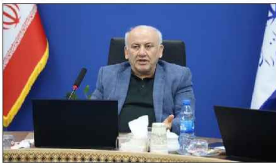
استاندار مازندران: ایستا: استاندار مازندران با تاکید بر اینکه هیچ گونه نگرانی از بابت تامین کالاها و سوخت و مسوخت در مازندران وجود ندارد، گفت: شهروندان استان از هجوم بی رویه به فروشگاه‌ها و جایگاه‌های عرضه سوخت خودداری کنند.

همین راستا، تعداد ناوایی‌ها در سطح استان حدود صد واحد افزایش یافته است. همانطور که در ناآرامی‌های اخیر نیز