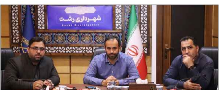
گلچین امروز: جلسه بررسی و طراحی سایت ترمینال جدید رشت با حضور شهردار رشت، جلسه برگزار شد. به گزارش امور ارتباطات شهرداری رشت، جلسه

بررسی و طراحی سایت ترمینال رشت با حضور رحیم شوفی شهردار رشت و جمعی از مدیران شهرداری برگزار شد. در این جلسه طرح پیشنهادی ترمینال جدید شهر رشت بر اساس نیازهای موجود بررسی شد. استناداردها و ضوابط آن امکان‌سنجی و مطالعات تاریخی انواع ترمینال‌ها در شهرهای مختلف مورد بررسی قرار گرفت. همچنین بر اساس نوع ساختار ترمینال، مواردی از جمله پارکینگ، هارسنوران و سکوها در نظر گرفته شد و شاخص‌های معماری بومی با توجه به جغرافیا و فرهنگ گیلانی در این زمینه مورد توجه قرار گرفت.