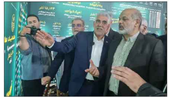
است. اظهار کرد: در طی ۲ نیم سال گذشته و در راستای معرفی ظرفیت‌های گیلان اقدامات خوبی صورت گرفته که نمونه بارز آن را در

نمایشگاه اکسپو در سال جدید شاهد بودیم. وی همچنین با قدرتی از اقدامات صورت گرفته در غرفه گیلان در نمایشگاه دستاوردهای اقتصادی گفت: باید گیلان با این ظرفیت‌های کم‌نظیر به خوبی برای جهانیان معرفی شود. گفتنی است وزیر کشور خاطر نشان کرد: استان گیلان با ۲۰ موقعیت سرمایه‌گذاری ۹۰ هزار میلیارد تومانی، در نمایشگاه ایران اکسپو ۲۰۲۴ (فرصت‌های سرمایه‌گذاری و توانمندی‌های صادراتی کشور) حضور دارد.