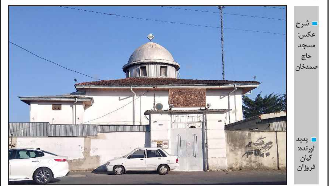
شرح عکس: مسجد حاج صمدخان